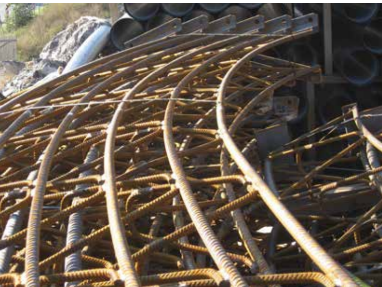
3-Gurt-System/3-bar girder system

Material description of reinforcing steel BSt 500B Other versions on request.